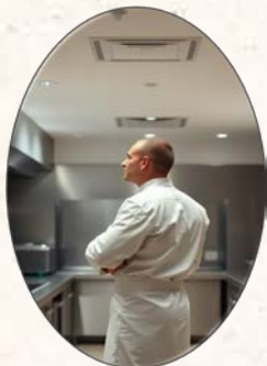
Porteurs de projets